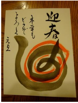
Written by Ms. Kamimura